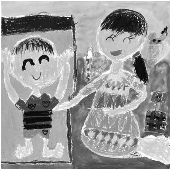
平成28年度知事賞受賞作品 「弟がはじめてわらったよ。」

かぞく みちか おとな のこ たいけん えが ～家族や身近な大人との こころに残る体験を描いてください！～