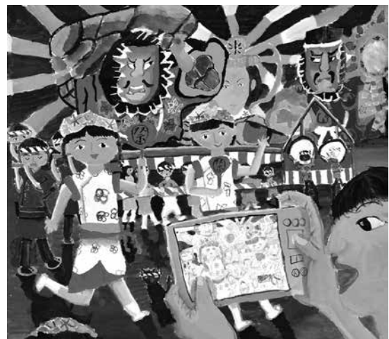
平成28年度東京都教育委員会賞受賞作品 「ラッセラー！ラッセラー！」